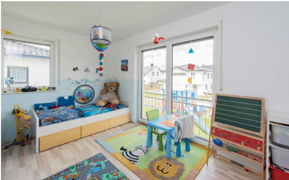
Das Kinderzimmer bietet reichlich Platz zum Spielen.

Viel Platz zum Spielen oder für ein Treffen mit Freunden bietet auch das Kinderzimmer. Das Bad ist etwas mehr als 8 qm groß. Ein helles, breites Treppenhaus sorgt für einen großzügigen Gesamteindruck. Insgesamt Platz satt. Ein rot-weißer Außenanstrich macht die Stadtvilla zu einem Eye-Catcher.