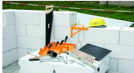
Ytong Bausatzhaus-Werkzeuge (Beispiel) Abweichungen in jeglicher Hinsicht sind möglich!

Alle weiteren Werkzeuge sind bauseitig )* zu stellen.