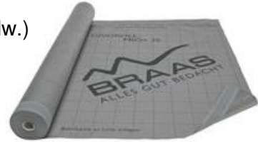
Abb. kann von der gelieferten Ware im Typ und Farbe abweichen