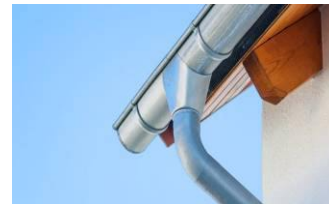
Abb. nur Beispielhaft