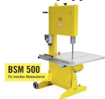
Abbildung nur beispielhaft. Der genaue Bandsägetyp wird später mit Baubeginn festgelegt!

)* „bauseitig“ bedeutet: Leistungen, die Sie eigenständig kostenlos erbringen bzw. bereitstellen