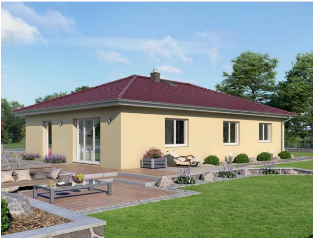
Bungalow BGL 119: Abbildung enthält Sonderausstattungen!

Mit diesem Bungalow BGL 119 erhalten Sie einen Bausatz zur Errichtung des geschlossenen glasdichten Rohbaus. Verbunden mit der Planung wird der Bungalow BGL 119 den aktuellen bautechnischen Anforderungen sowie der Energieeinsparverordnung gerecht.